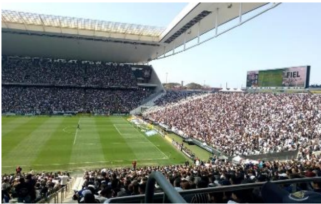
Figura 1 – Arena Corinthians