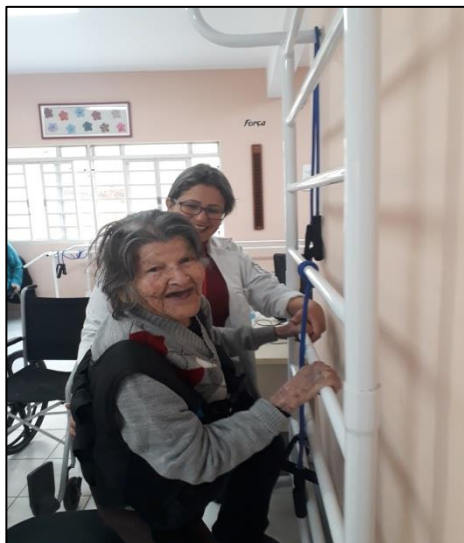
Figura 3 – Atendimento fisioterapia