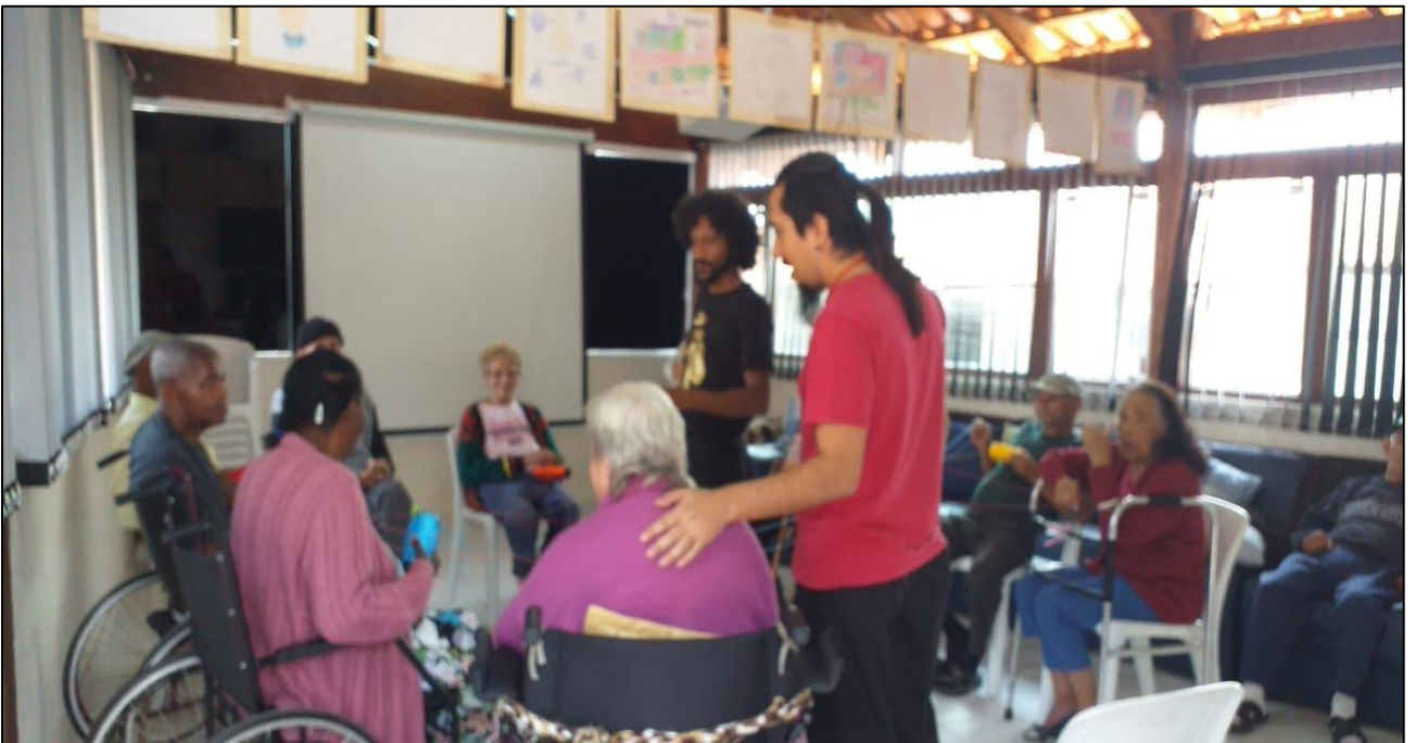
Figuras 1 e 2 – Roda de Conversa