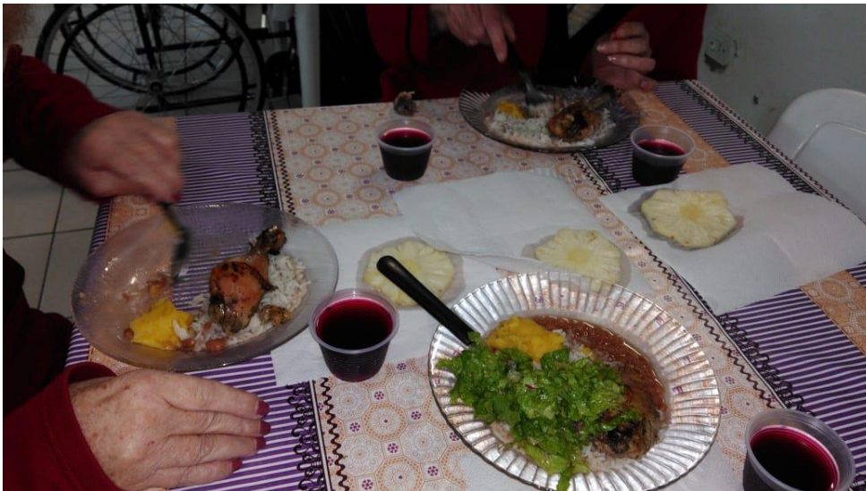
Figuras 2 – Almoço