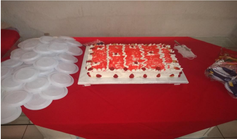
Figuras 1 – Aniversariantes do Mês