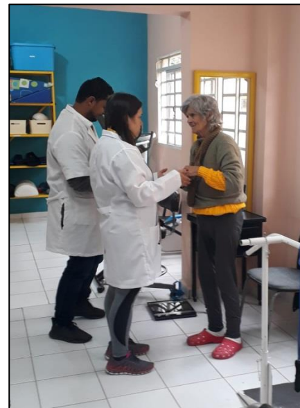
Figura 2 – Atendimento fisioterapia