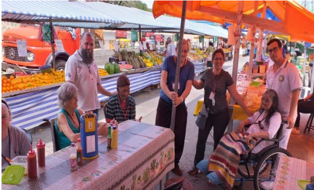
Figura 2 – Passeio feira