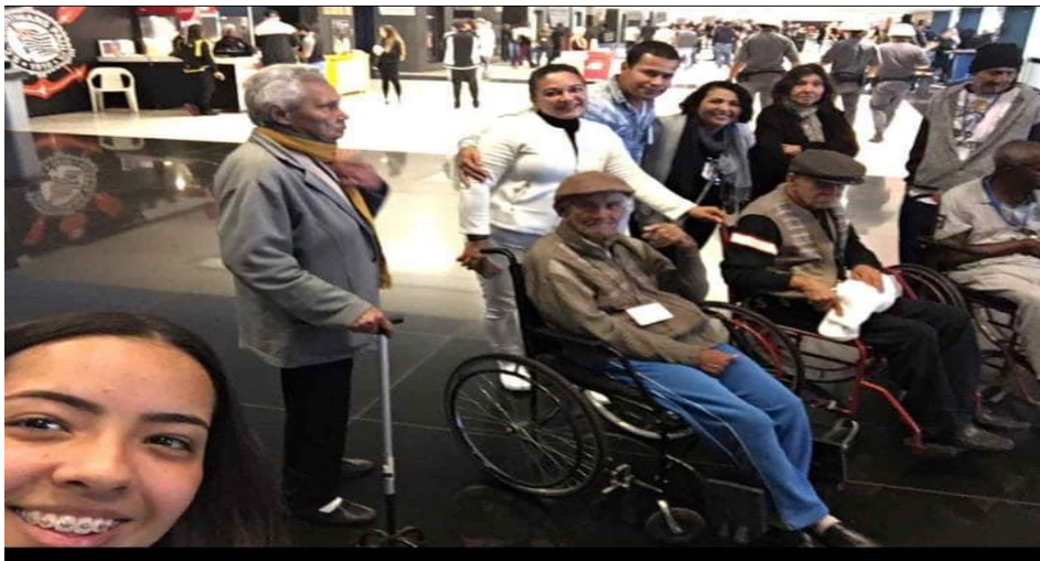
Figura 3 – Aguardando para entrar no estádio