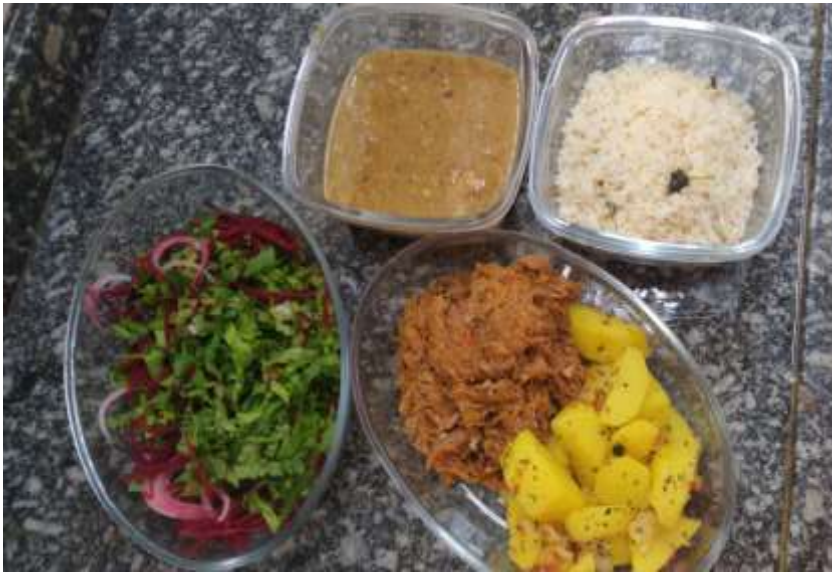
Figura 1 – Almoço