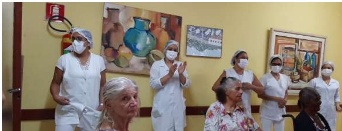
Figura 1 – Aniversariantes do Mês