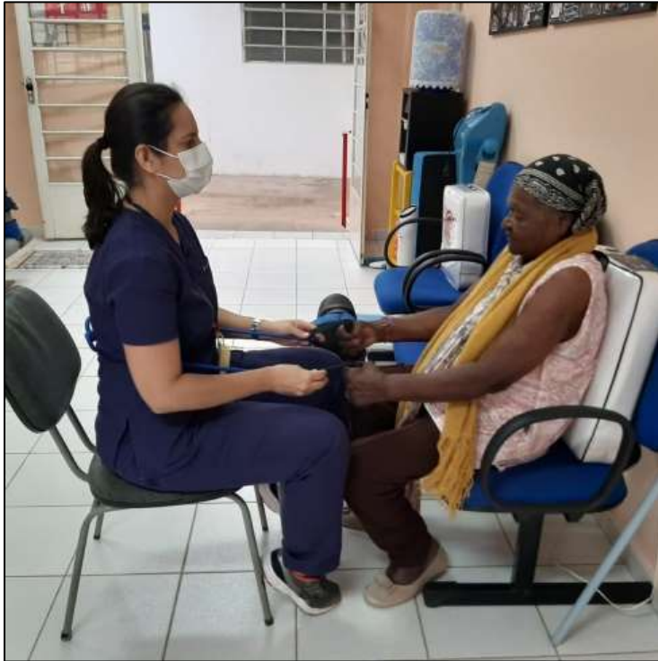
Figura 1 – Cinesioterapia