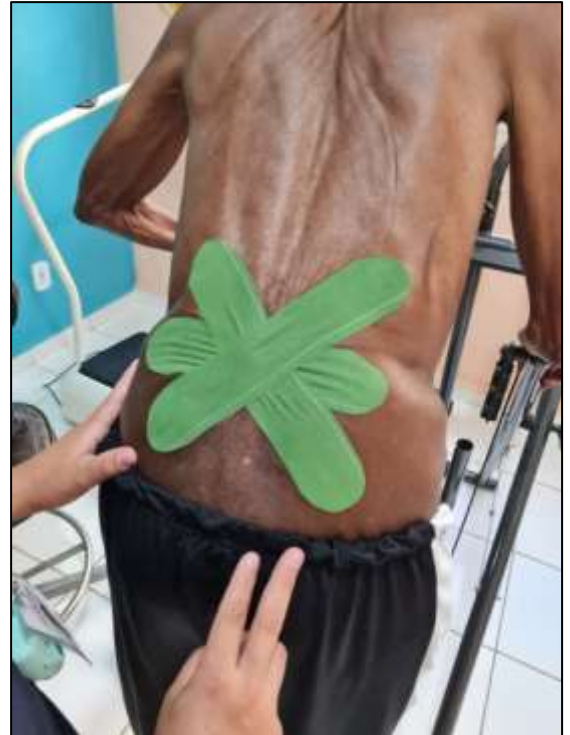
Figura 2 – Bandagem Funcional