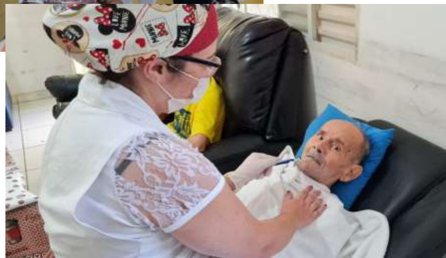
Figura 2 e 3 – (Tricotomia Facial)

Lar Mãe Mariana - Sede: Rua Monte Castelo, 116 - Bairro Biritiba - Poá/SP - Cep: 08562-460 Fone: 4638-1475 - e-mail: larmaemariana@gmail.com.br - CNPJ: 43.870.179/0001-40