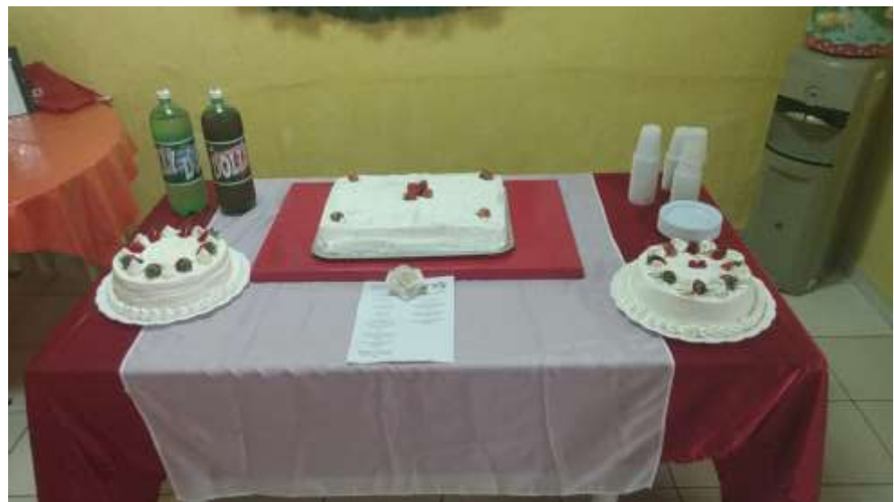
Figura 2 – Aniversariante do Mês