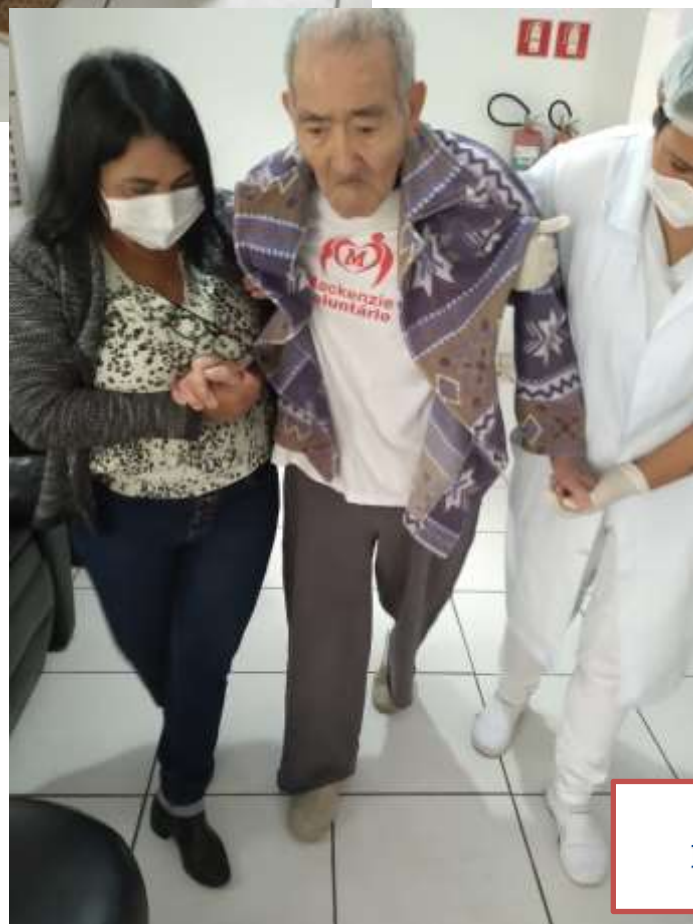
EXERCÍCIO DE DEAMBULAÇÃO