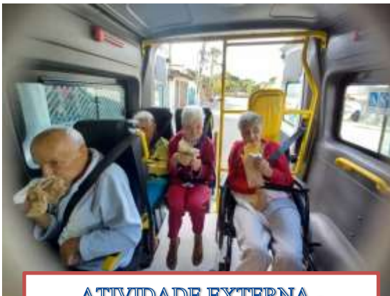
ATIVIDADE EXTERNA - PASTEL