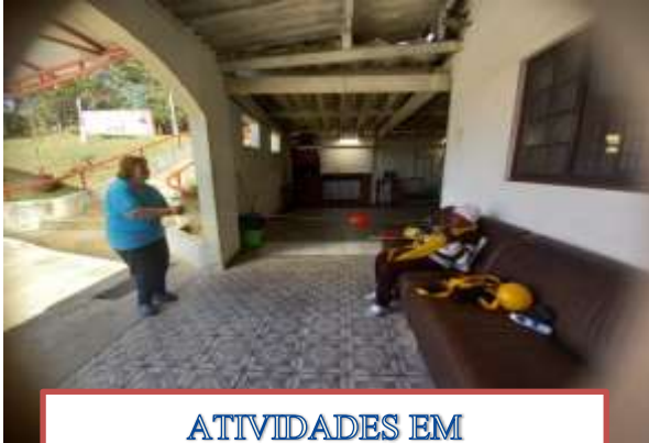
ATIVIDADES EM GRUPO