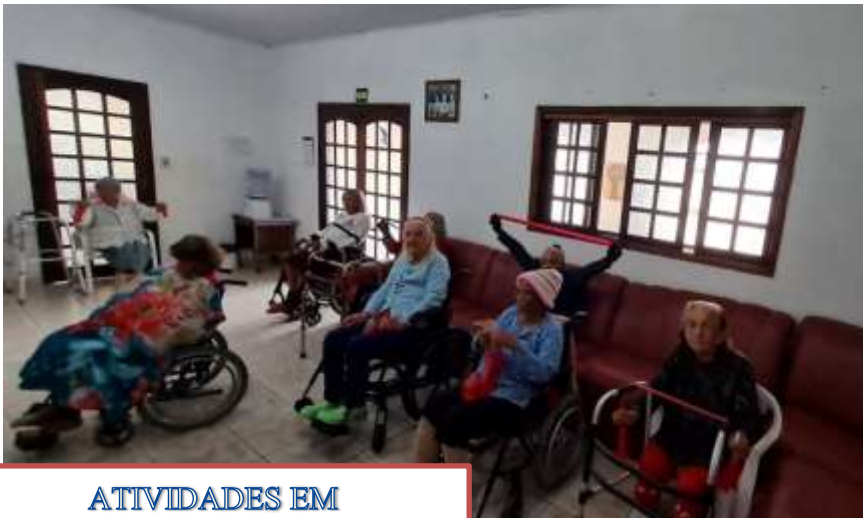
ATIVIDADES EM GRUPO