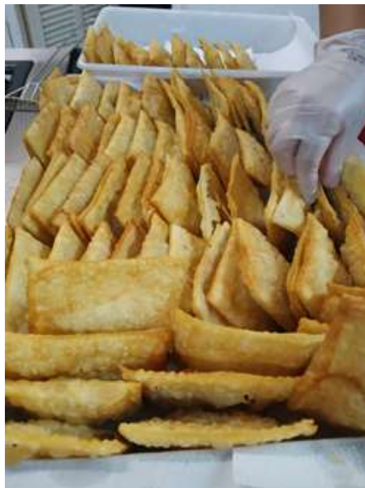
DIA DO PASTEL