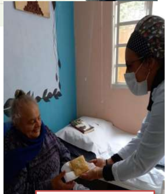
DIA DO PASTEL