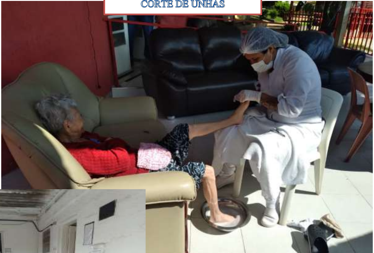
CUIDADO HUMANIZADO CORTE DE UNHAS