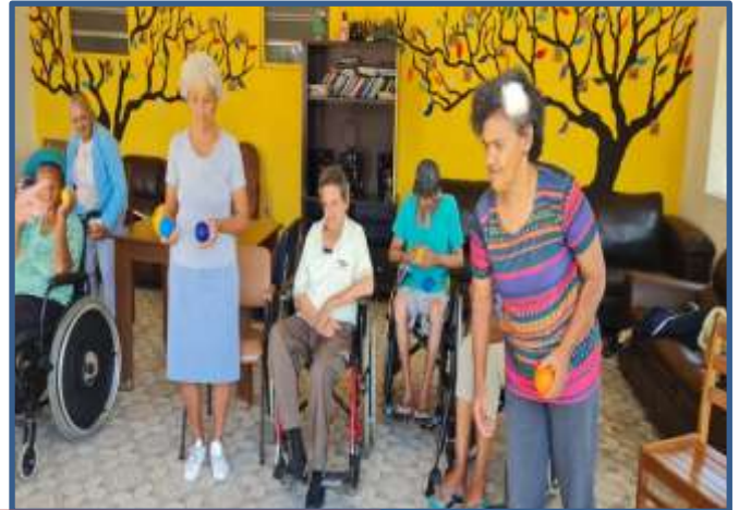
ATENDIMENTO INDIVIDUAL e GRUPO