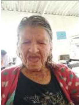
FORTALECIMENTO DE VÍNCULO