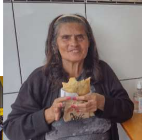
PASSEIO NA PASTELARIA