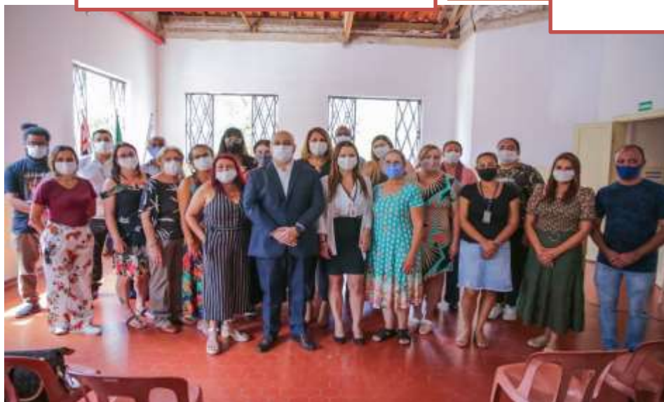
ELEIÇÃO BIÊNIO CMAS DE POÁ