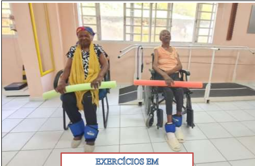
EXERCÍCIOS EM GRUPO