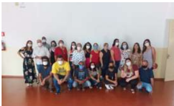
POSSE BIÊNIO CMAS DE POÁ