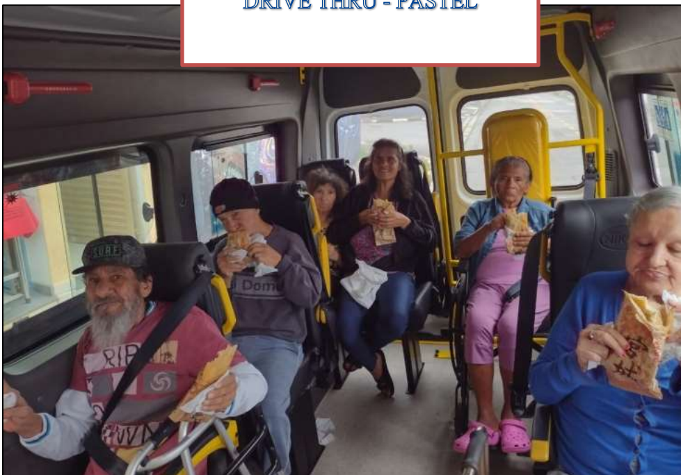
DRIVE THRU - PASTEL