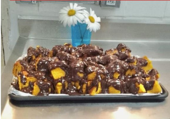
DIA ESPECIAL – DIA DAS MÃES (Bolo de cenoura com cobertura de chocolate)