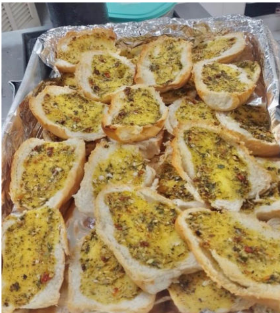
PRATO DOS DESEJOS (torrada com azeite e ervas)