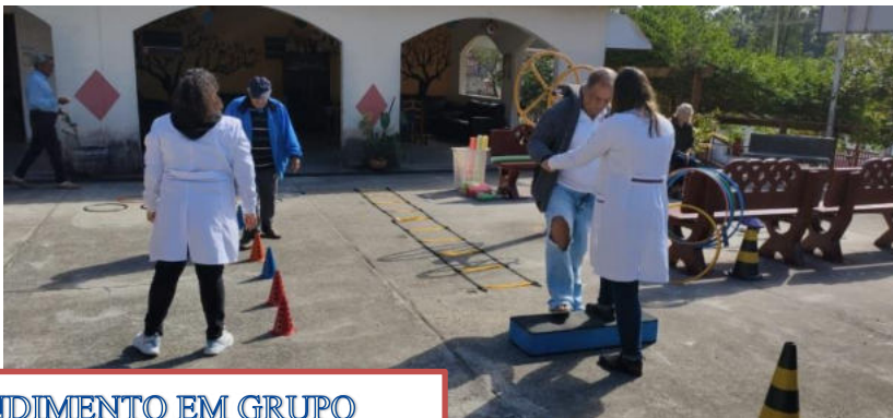
ATENDIMENTO EM GRUPO (Circuito)