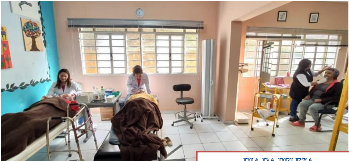
DIA DA BELEZA