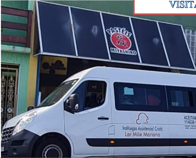
ATIVIDADE EXTERNA VISITA A PASTELARIA