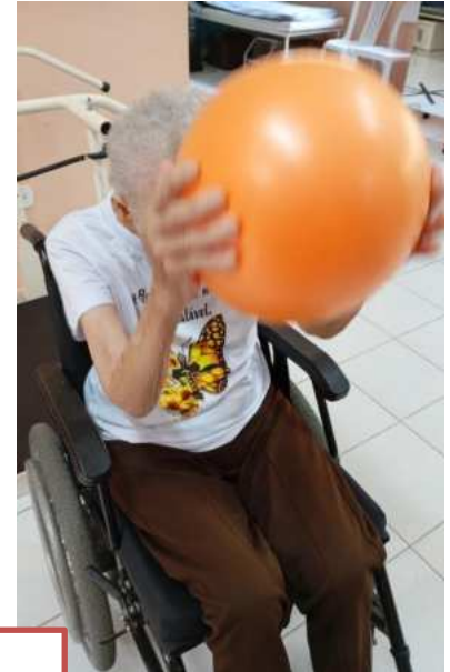
ATENDIMENTO FISIOTERAPÊUTICO Individual