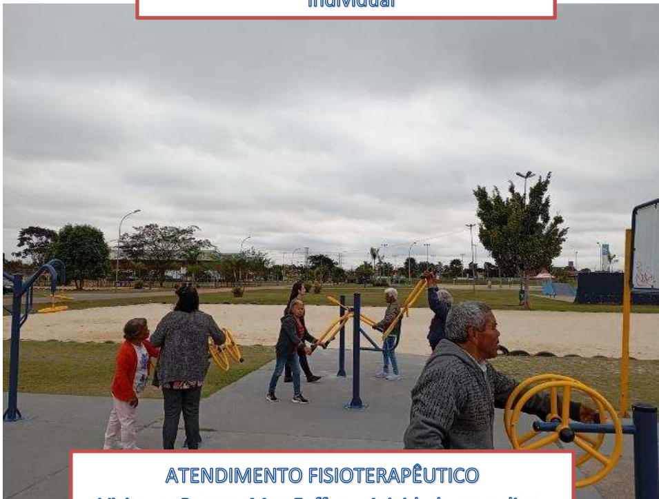
ATENDIMENTO FISIOTERAPÊUTICO Visita ao Parque Max Feffer – Atividade ao ar livre