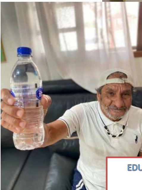
EDUCAÇÃO NUTRICIONAL: Hidratação