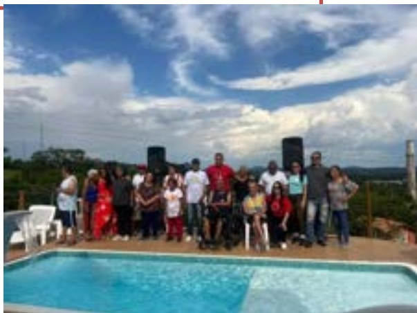
Passeio chácara Itatiba