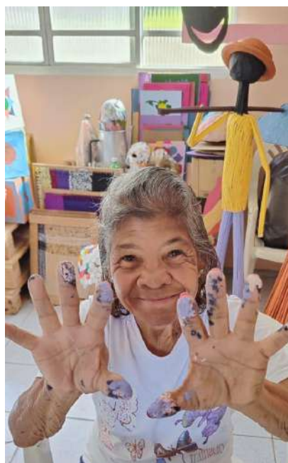
FINALIZAÇÃO DOS JOGOS COGNITIVOS