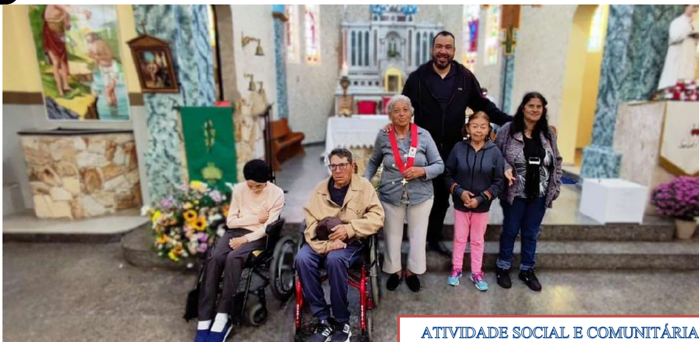
ATIVIDADE SOCIAL E COMUNITÁRIA VISITA A IGREJA MATRIX