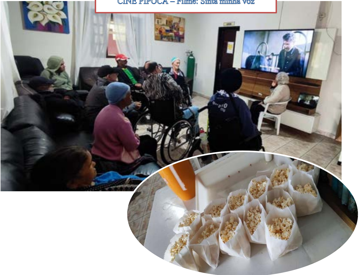
CINE PIPOCA – Filme: Sinta minha voz